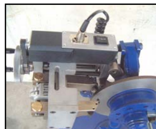
ART. 302 - stáčečka