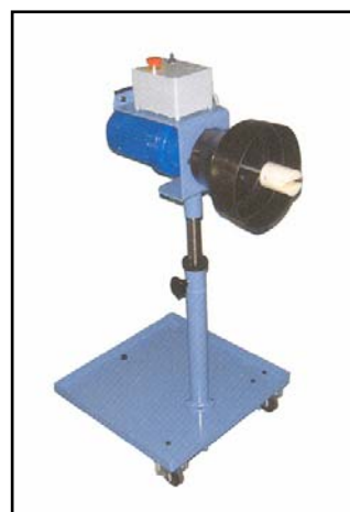
ART. 322 – vozík s pohonem nápravy