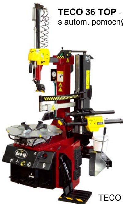
TECO 36 TOP

TECO 36 TOP - TOP automat zouvačka 10" - 25", ideální pro nízko profilová a tvrdá pneu... s autom. pomocnými rameny, pneumatickým palcem... jen za 134 910,- Kč (zvedák kol za příplatek)