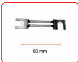
Fuse 80 mm: 100 A Cod. 40032