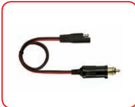
ø 12 mm - 15 A Cod. 40010

Cavi con spine accendisigari / Cables with cigarette lighter plugs: