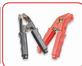
650/800/1000 A Curve in ottone Curved in brass Cod. 40025, 40026, 40027