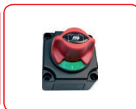
MAX 24 V - 300 A 1000 A x 5 s Cod. 40043 Con manopola rotante on/off With rotational switch on/off