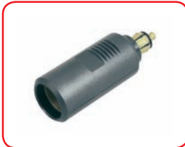
ø 21/12 mm 16 A Adattatore / Adaptor Cod. 40015

Prese tipo accendisigari / Cigarette lighter sockets: