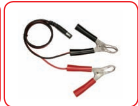
Cavo con pinze 30 A Cable with clamps 30 A Cod. 40014

Prese tipo accendisigari / Cigarette lighter sockets: