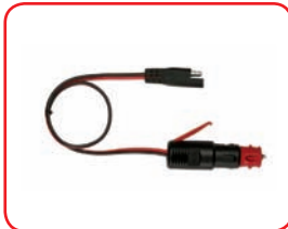
ø 21/12 mm - fuse 8 A Cod. 40011