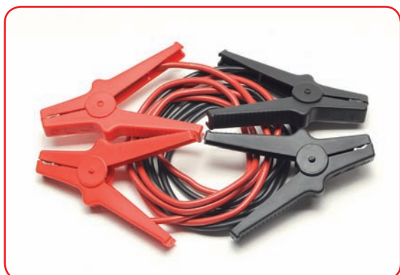
Set cavi con pinze in plastica Cables set with plastic clamps