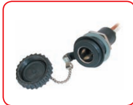
ø 12 mm 16 A Protetta dall'acqua IP67 Waterproof IP67 Cod. 40017