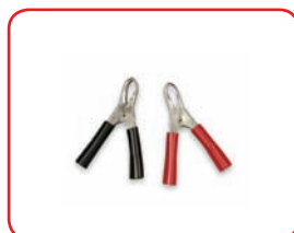
40 A In lamiera / Stainless Cod. 40020