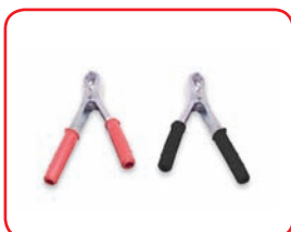
60 A In lamiera / Stainless Cod. 40021