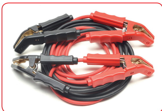
Set cavi con pinze curve in ottone Cables set with melted brass curved clamps