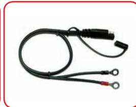
Cavo con occhielli ø 6 mm Cable with rings ø 6 mm Cod. 40013