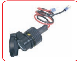
ø 21 mm 10 A Moto / Motorcycle Cod. 40018