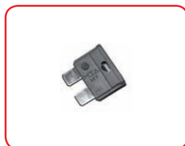
Fuse unival: 3 A - 4 A - 5 A 7,5 A - 10 A - 15 A - 20 A 30 A - 40 A Cod. 40030