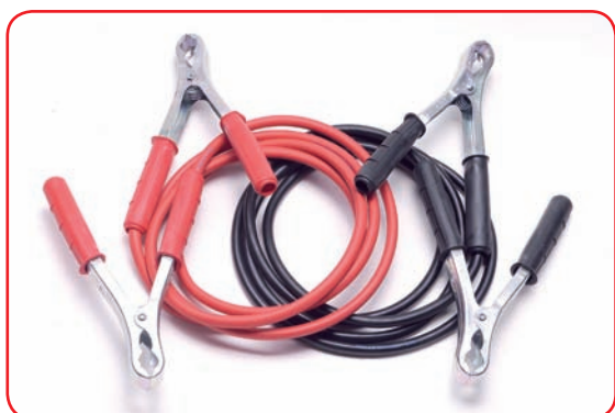
Set cavi con pinze in lamiera Cables set with stainless clamps