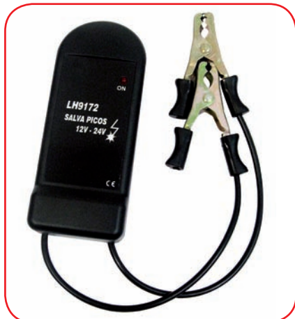
Protettore picchi di tensione - 12/24 V Peack Save - 12/24 V - cod. LH91721