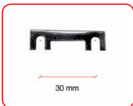
Fuse 30 mm: 30 A 50 A 80 A Cod. 40031