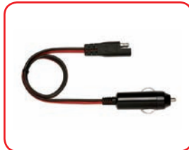
ø 21 mm Cod. 40012