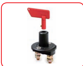
MAX 24 V - 100 A 500 A x 5 s Con chiave estraibile / With removable key Cod. 40041