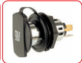
ø 21 mm 20 A Auto / Car Cod. 40019