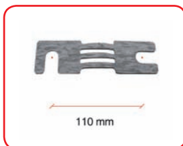
Fuse 110 mm: 500 A Cod. 40033