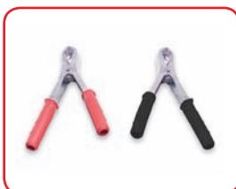
120 A In lamiera / Stainless Cod. 40022