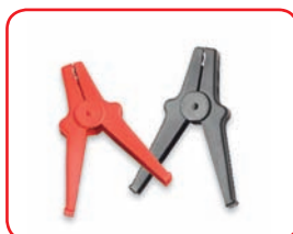
120/500 A In plastica / Plastic Cod. 40023, 40024