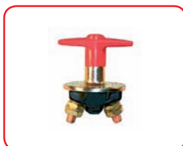
MAX 24 V - 300 A 1000 A x 10 s Con maniglia fissa / With fixed handle Cod.40042