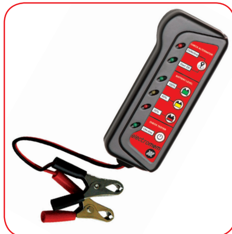
Mini Tester - 12 V - 1/70 Ah test - cod.020110