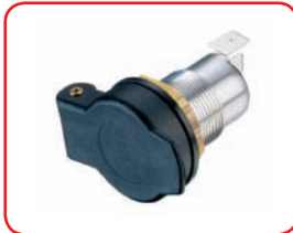
ø 12 mm 16 A Moto (BMW) / Motorcycle (BMW) Cod. 40016