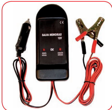
Salva memorie - 12 V / Memory Save - 12 V cod.LH9180